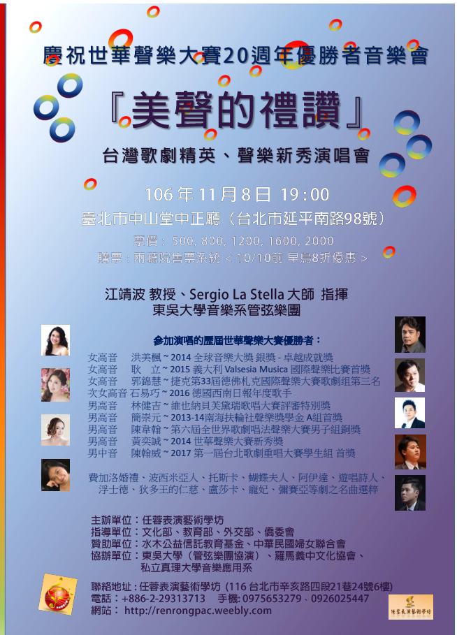
『美聲的禮讚』音樂會 小海報