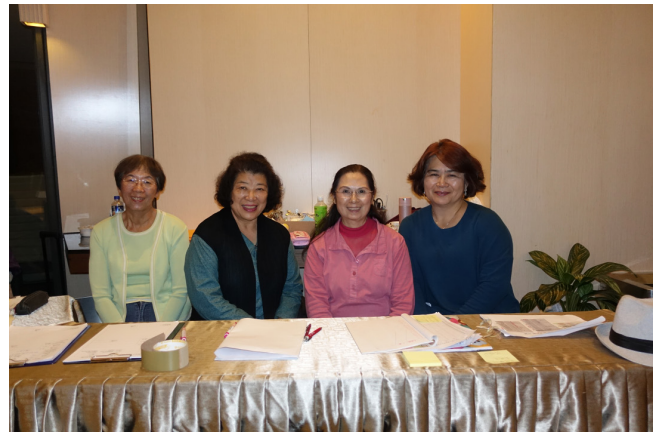
大賽接待志工須從早待命到晚