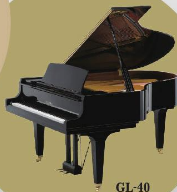
GL-40 180 (L) x 152 (W) x 102 (H) cm