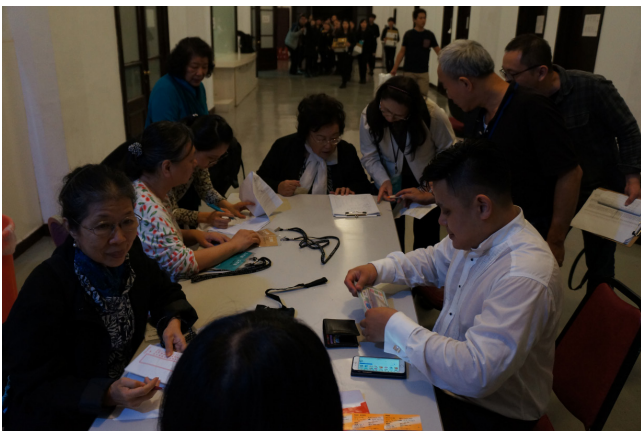
音樂會中正廳後台