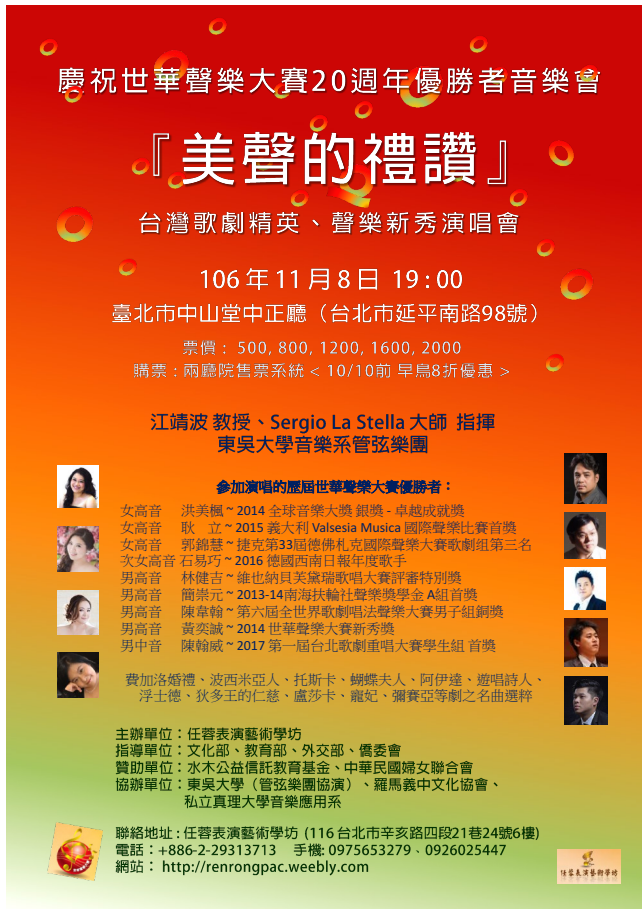
『美聲的禮讚』音樂會 大海報