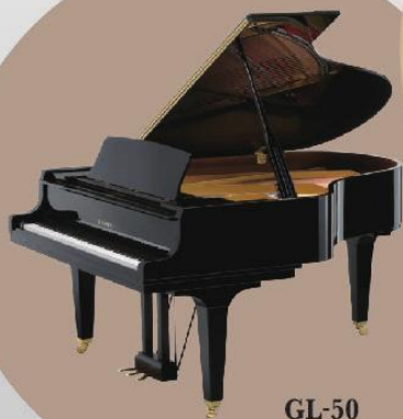
GL-50 188 (L) x 152 (W) x 102 (H) cm