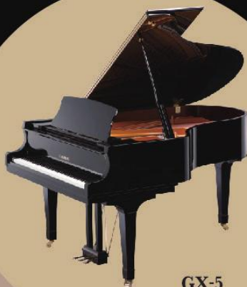
GX-5 200 (L) x 153 (W) x 102 (H) cm