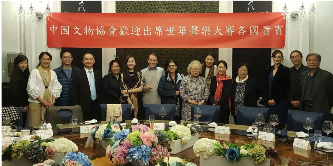
各國貴賓應邀出席筵席