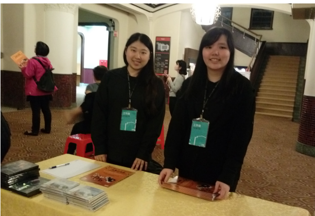
真理大學音樂應用系藝術行政組學生 擔任音樂會前台工作