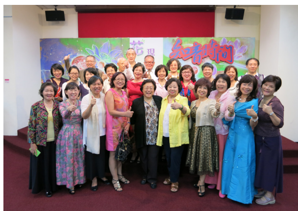
台北市藝文推廣處一樓大廳 “知音時間”演出合影