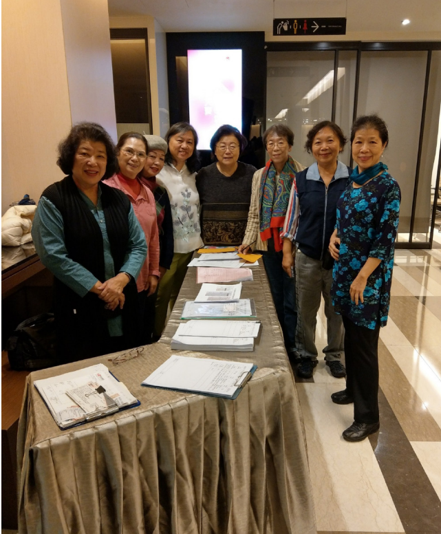
大賽接待志工與任會長合影