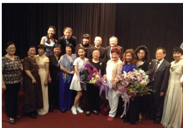
台北市議會禮堂音樂會演出合影